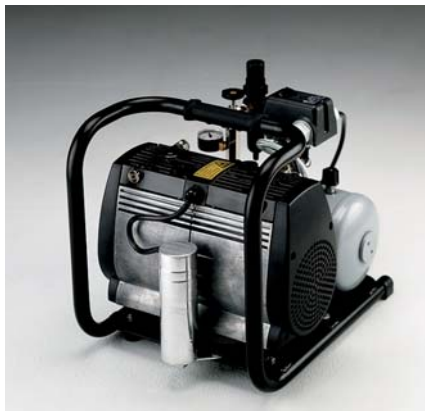
Jun-Air Kompressor OF302-4B

Tankgröße 4 l Gewicht 22 kg Maße (LxBxH) 390 x 320 x 350 mm Bestell-Nr. 1608202