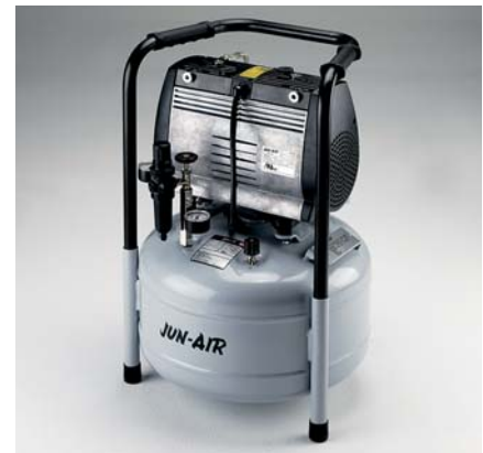
Jun-Air Kompressor OF302-25B

Tankgröße 15 l Gewicht 25 kg Maße (LxBxH) 380 x 380 x 530 mm Bestell-Nr. 1608783