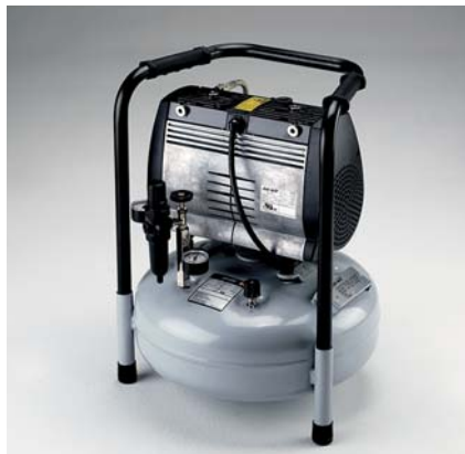
Jun-Air Kompressor OF302-15B

Tankgröße 4 l Gewicht 22 kg Maße (LxBxH) 390 x 320 x 350 mm Bestell-Nr. 1608202